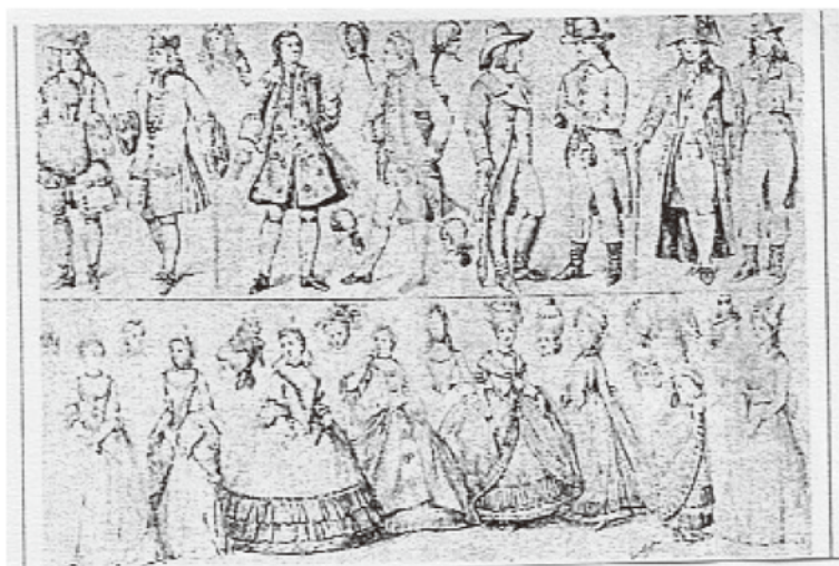
図2 「おんな」「おとこ」違いが小さい18世紀の衣装

こうした「おんな」、「おとこ」の一元論が大きな転換を迎えたのは、19世紀になってからであった。そこでは、「おとこ」のからだと「おんな」のからだの間の壁は高まり、両者は次第に二元論的に捉えられるようになったのであった。科学