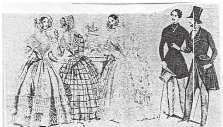
図3 「おんな」「おとこ」の差異が大きくなった19世紀半ばの衣装

こうした新たな「おとこ」「おんな」の誕生は、とくに、「おとこ」の衣装の変化に反映されることになった。「おんな」の服装はそれほど、大きな変化しなかったのに対して、変化をこうむったのは「おとこ」のそれであった。「おとこ」の衣装は次第に、モノクロ化、性器の隠蔽するようになる。端的な例はそれまで、男性性器への矢印の意味を持っていたネクタイの先の部分が上着によって隠されるようになり、性的機能は大きく後退した。(図3)