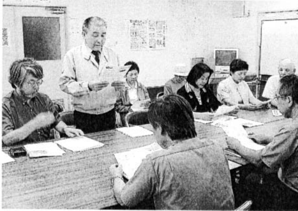
鉄道建設・運輸施設整備支援機構への申し入れ書を読み上げる住民代表 (左から 2 人目) 〓 水俣市

九州新幹線 (新八代 - 鹿児島中央間) の騒音調査で、熊本県内の沿線住宅地約二百五十地点の三割以上が環境省の騒音基準を超えた問題で、同新幹線による騒音・振動被害を訴えている水俣市と八代市の住民らが五日、鉄道建設・運輸施設整備支援機構水俣鉄道建設所 (水俣市) を訪ね、調査結果公表などを文書で申し入れた。